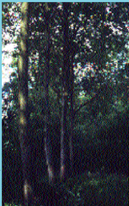
Flevo : peuplement adulte 16 ans.

Branchaison : nombre de branches : - moyen dimension des branches : - moyenne charpentières : - fréquentes fourches : - peu fréquentes interverticille : - sans branche gourmands : - aucun